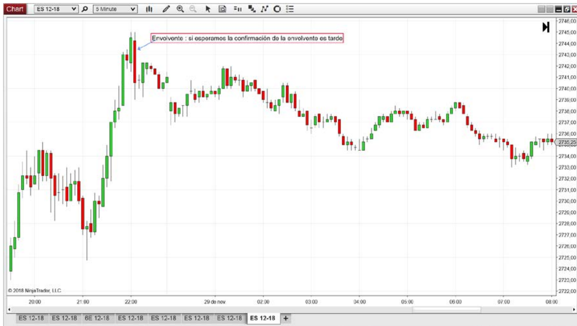
Gráfico con Envoltente (Engulfing) : Indecisión y rechazo en 5 minutos : si esperamos la confirmación de la envolvente ya sería demasiado tarde.

Ahora mira la tabla de ordenes dentro de la con la huella de flujo de ordenes (order flow)